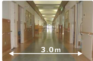
リハビリに適した広い廊下