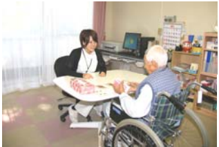
言語聴覚室 (個別療法室 7室)