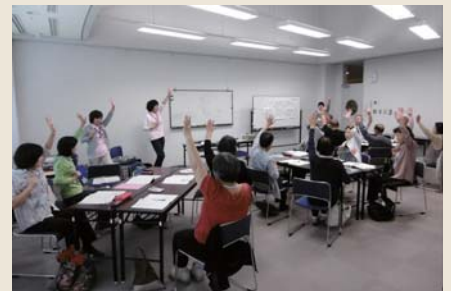
高齢者あんしんセンター「はるな」・「くらぶち」