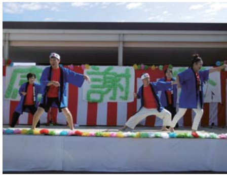
職員 6 名で総踊り「黒田節」を披露