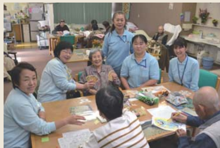
はるな夢工房 (通所介護)