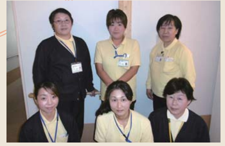
訪問看護ステーション榛名荘 (訪問看護)