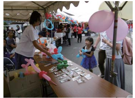
職員によるバルーンアート