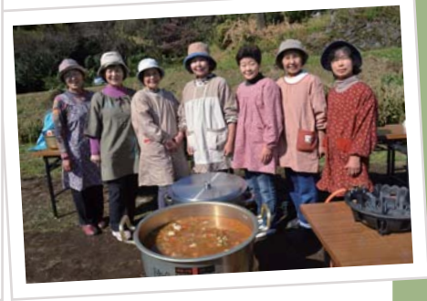
大鍋で作るけんちん汁は最高