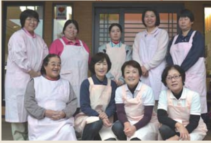
ホームヘルパーステーション榛名荘 (訪問介護)