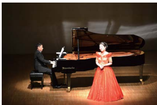
ピアノとの息もぴったり