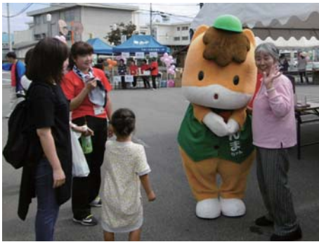
ぐんまちゃんと記念撮影

当日は、榛名高校生も吹奏楽の演奏やボランティアとして大活躍。また、和太鼓、フラダンス、フォークダンス、八木節等の演芸、模擬店で楽しんでいただきました。