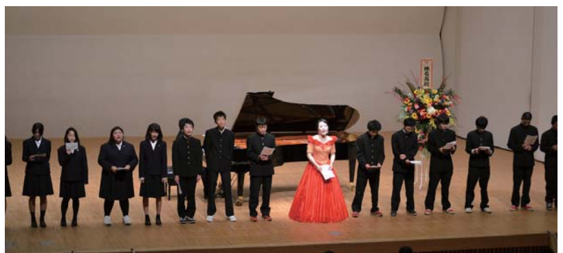
榛高生もステージで校歌を熱唱