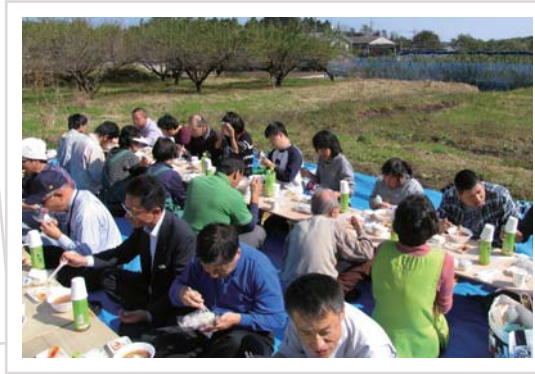
自ら育てた野菜に舌つづみ