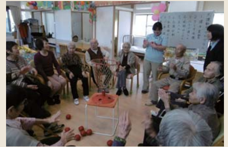
複合型サービス玉まゆ (看護小規模多機能型居宅介護)