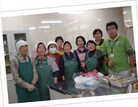
エプロンを着て、いざ調理

収穫祭では、地活利用者さまが榛名厚生会職員の支援を受けて育てた野菜を、地域のボランティア団体「エプロンの会」・「山吹の会」のみなさまに調理していただき、参加者にふるまいました。雲ひとつない晴天の下、けんちん汁、おにぎり、ポテトフライ（八つ頭を使用）、梅ジャム等を全員でいただきました。