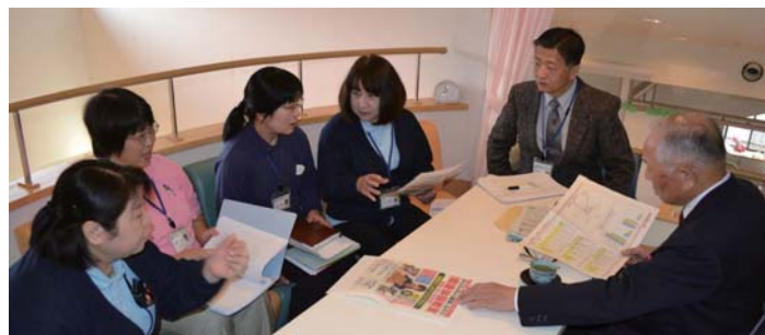
部門長会議 女性ならではの生活支援、市民目線で自由な意見交換が行われる。