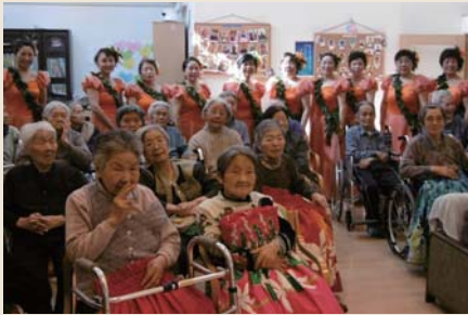
グループホーム榛名荘 (認知症対応型共同生活介護)