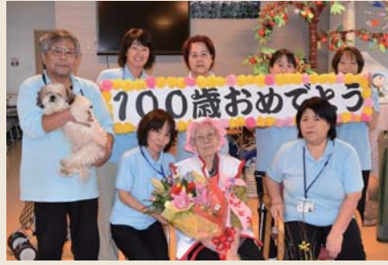
デイサービスセンター榛名荘 (通所介護)