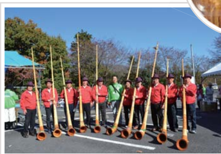
気分はスイス 花咲アルプホルンクラブ さま