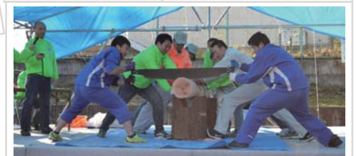
会場は大盛り上がり 第1回 丸太早切大会