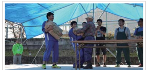
第1回優勝チームは榛名高校生の兄弟 優勝賞品はもち米1俵!