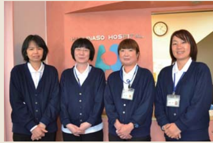
各事業所を支える管理部