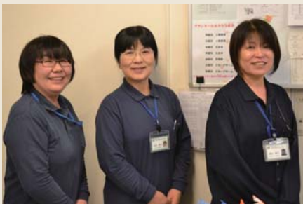
居宅介護支援センター榛の木 (居宅介護支援)