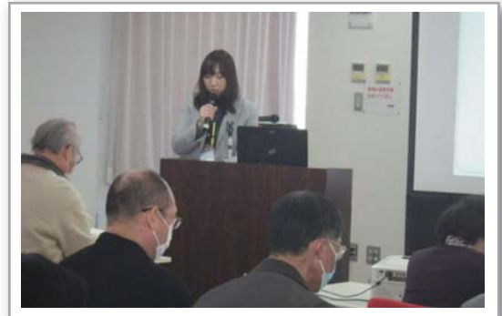
認知症についてDVD鑑賞、高齢者あんしんセンター職員による講演会の様子

夕食を食べたのに、まだ食べていないと言われたら、否定せず夕食ができるまでお茶とお菓子でテレビでも見て待っていてと納得させ、欲求状態を満たしトラブルを防ぎます。