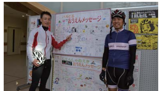
子どもたちからの応援メッセージ

2013年より開催されている「榛名山ヒルクライム in 高崎」の人気にともない、サイクリストが増加しましたが、休憩所がなかったことから福祉会館前にサイクルスタンドを設置したり、施設内のロッカーやトイレの利用、メンテナンスのための工具無料貸出サービスを始めました。