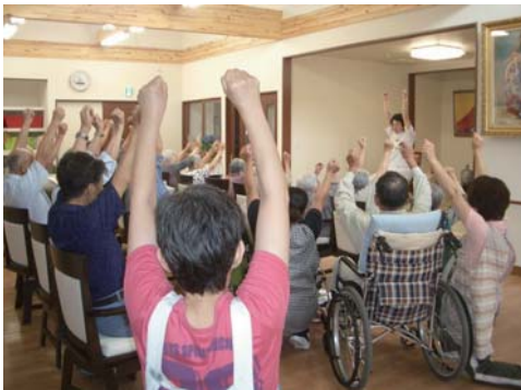
実地指導（予防体操）

地域から依頼があった場合に、理学療法士・作業療法士・言語聴覚士・歯科衛生士を派遣しています。地域リハビリテーションの実地場面では、当院を退院して元気に頑張っている方の笑顔に出会うこともたくさんあります。入院中の段階から患者さまの退院後の在宅生活を見据えて、リハビリテーションを提供することはとても重要なことです。そのため、地域にお住いの方々と密接に関わることは、リハビリスタッフにはとても貴重な経験となっています。