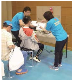
健康管理センタースタッフ による「健康チェックコー ナー」