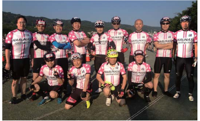
理事長をはじめ、職員も選手として毎年参加しています。