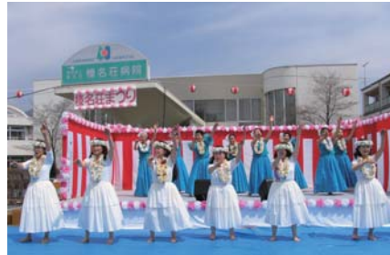
榛名フラダンス愛好会のみなさま