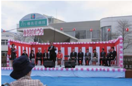
高崎市長のご挨拶

職員からも「達成感があつた」といった声が多く聞かれ、地域の中で医療・介護・福祉の中核施設として施設内だけでなく地域の中で活動する大切さを実感するイベントとなりました。