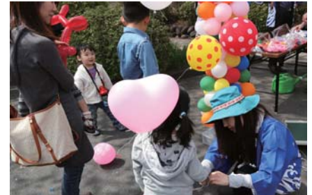
風船やわたがしのサービス