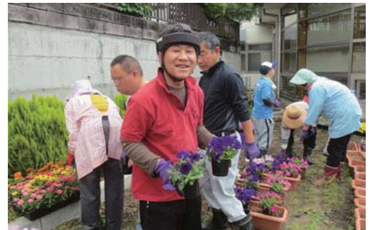
施設利用者さまと花のプランター設置